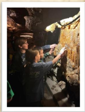
Museo Bullock Texas State History y Inner Space Cavern o Natural Bridge Caverns