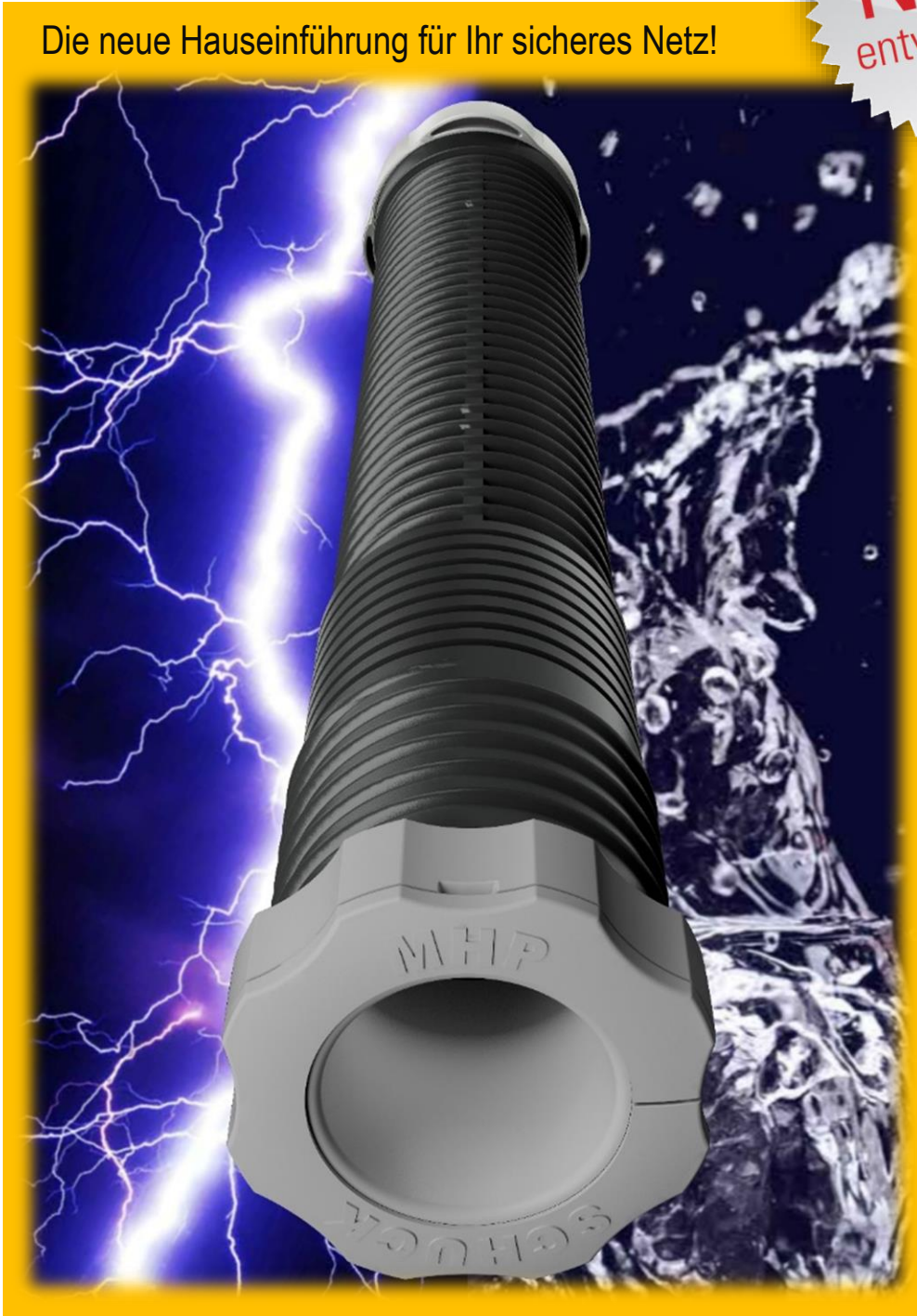
Der einfache Einbau

Die neue Hauseinführung für Ihr sicheres Netz!